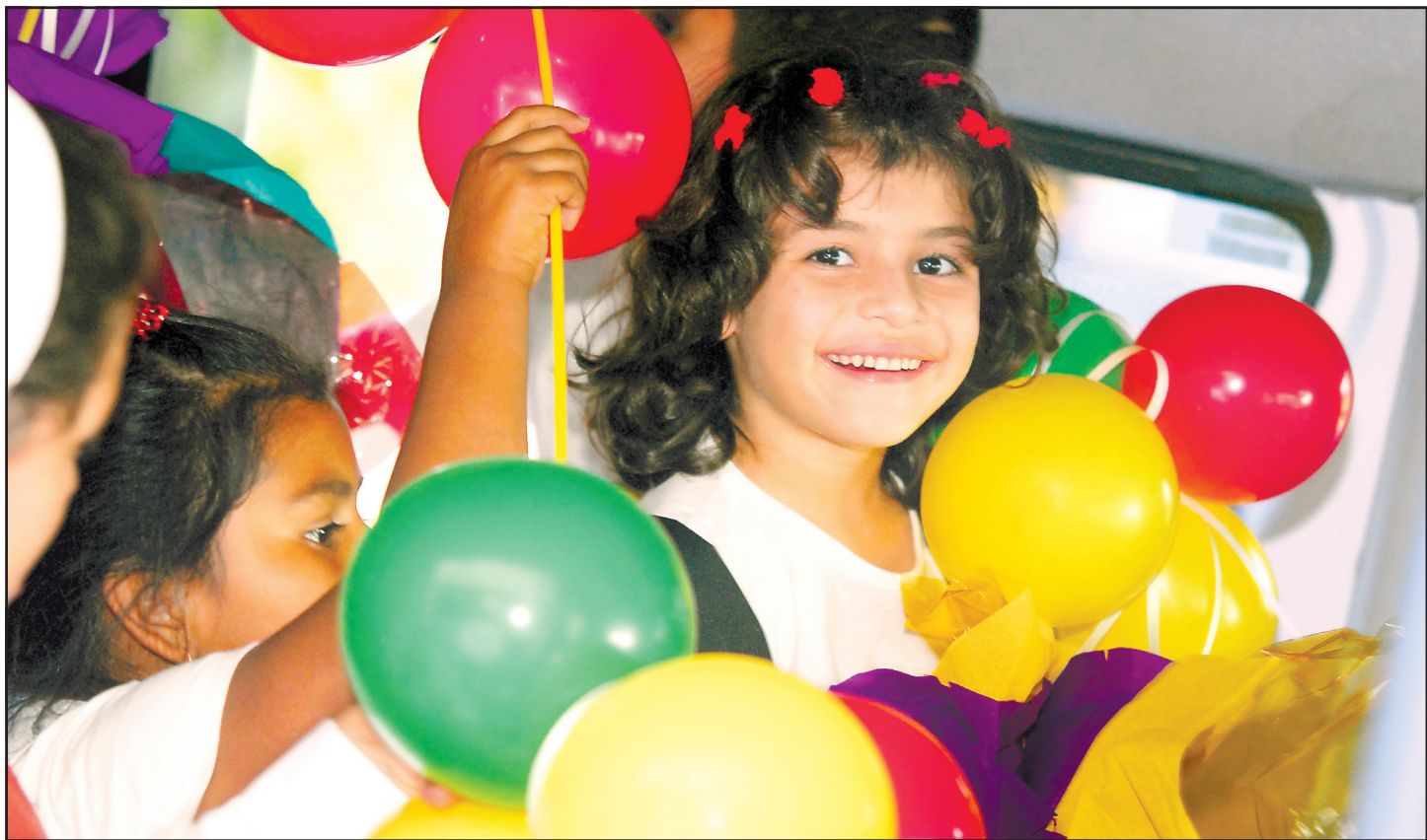
LA PRENSA/M. MATUTE