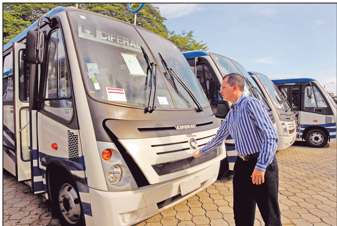
ESTOS BUSES SON LOS ÚNICOS que deberán cobrar más de 2.50 córdobas, según el Irtramta.