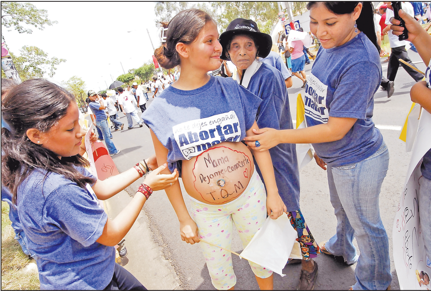
MILES DE NICARAGÜENSES de distintas partes del país participaron en la marcha contra el aborto terapéutico.